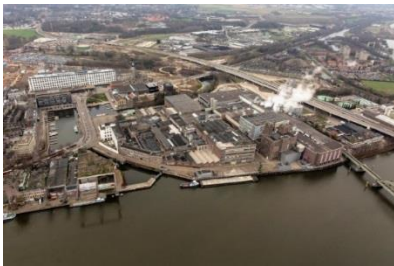
Luchtfoto Sappi – Landbouwbelang

In de voorliggende grex hebben wij de locatie Landbouwbelang derhalve niet meer budgettair neutraal afgesloten maar met een tekort van € 675.000,=. Dit tekort is meegenomen in de orendabele top van de grex. De boekwaarde blijft daarmee staan op € 6,5 mio.